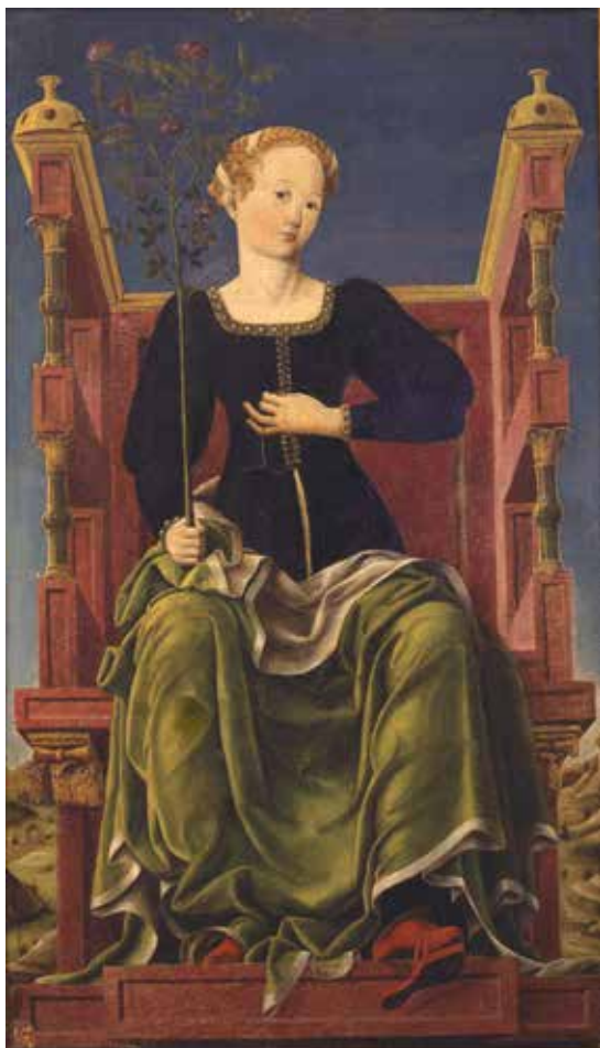
8. Angelo Maccagnino (?) e cerchia di Cosmé Tura, La Musa Erato , 1450 circa e 1458 circa, Firenze, in deposito presso la Soprintendenza B.A.S.

ture nel corso della gravidanza 55 , ma anche del gesto più consueto e coniugale necessario a liberarsi dalla veste. Sarebbe dunque ben presente la memoria di Leonello in questo dipinto anche nell'evocazione della fertilità della terra, e dunque esaltazione dell'agricoltura, ovviamente rappresentata dal paduro , impresa di Borso, ma riferibile anche a Leonello che già nel 1442 aveva dato inizio alla bonifica agricola del delta del Po 56 .