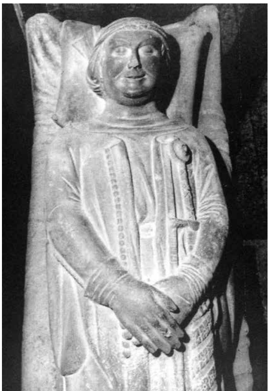
4. Maestro di Santa Anastasia, Cangrande I della Scala , Arca di Cangrande, 1329- 1340 circa, Verona, Museo di Castelvecchio