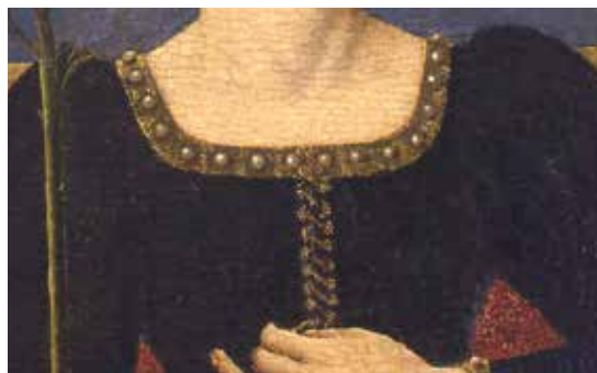
9. La Musa Erato , particolare del margheritino allo scollo e delle magete incoronate che coprono le asole dell'allacciatura

Ad un ulteriore livello astrologico, perle e magete indicano uno dei capisaldi dell'astrologia, e cioè la teoria che le divinità poste a soprintendere ogni segno zodiacale indicano doti e difetti, gusti e abilità che gli esseri umani nati sotto quel segno svilupperanno durante la loro vita: in questo caso Venere/estetica governa il carattere del principe che tutti i cronachisti descrivevano dotato soprattutto di "grazia", oltre che amante della poesia e della musica e mecenate delle arti 57 , e Vulcano/fabbro che determina la passione collezionistica del marchese per oggetti di piccole dimensioni fra i quali figurano numerosi i reperti metallici, come monete, medaglioni, borchie, fermagli 58 .