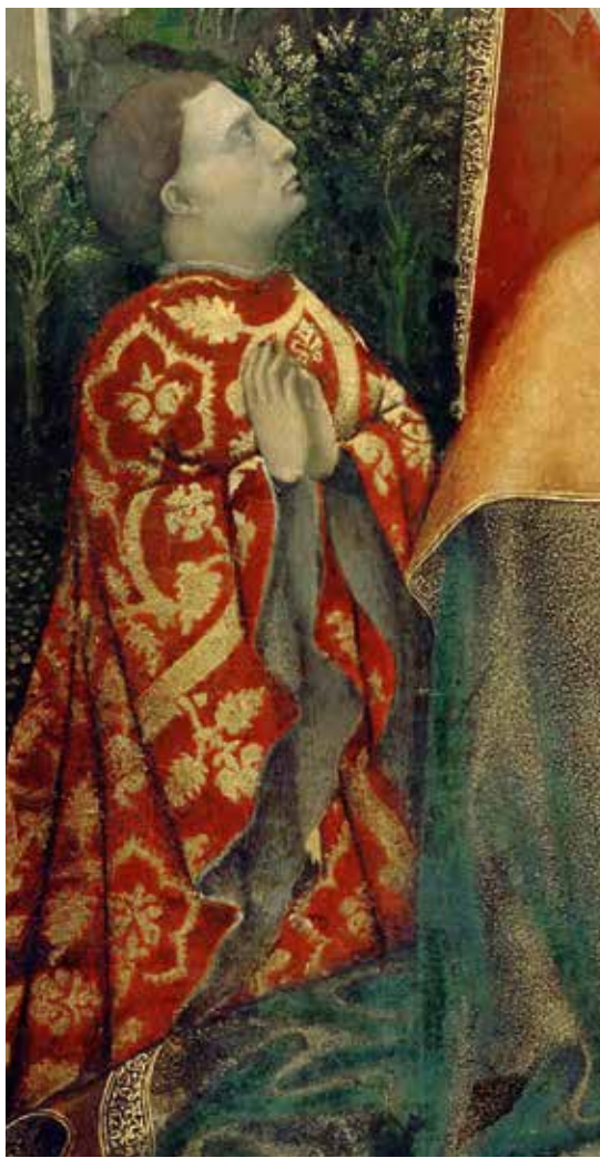
2. Jacopo Bellini, Madonna dell'Umiltà , 1445 ca. circa, Paris, Musée du Louvre

zo) 8 . Il disegno è quello della grande foglia pentalobata che racchiude una infiorescenza ricca di semi – in questo caso il fior di cardo – originariamente simbolo di eternità e appannaggio esclusivo di re e sacerdoti – che da secoli era venuto a rappresentare il ciclo vitale che nobiltà, clero e ricca borghesia ormai sfoggiavano all'unisono e che divenne il motivo più diffuso nelle due tipologie auro-seriche che rappresentavano lo status symbol nel Quattrocento. Le molteplici versioni possono essere ancora oggi viste nelle collezioni tessili, uguali a quelle raffigurate nei dipinti o nei disegni degli artisti, come quando, caso raro, il disegno tessile nel ritratto corrisponde perfettamente a un disegno dello stesso Pisanello (fig. 1). Il brochato d'oro rizzo e il velluto a griccia che vediamo nella sopraveste indossata da Leonello nel dipinto La Madonna dell'Umiltà di Jacopo Bellini 9 (fig. 2), erano le due stoffe auro-seriche più preziose