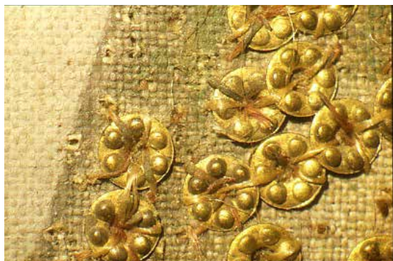
10. Paliotto della Vergine delle Rocce, 1486-1493, Sacro Monte di Varese, Museo Baroffio, particolare del ricamo: magete incoronate