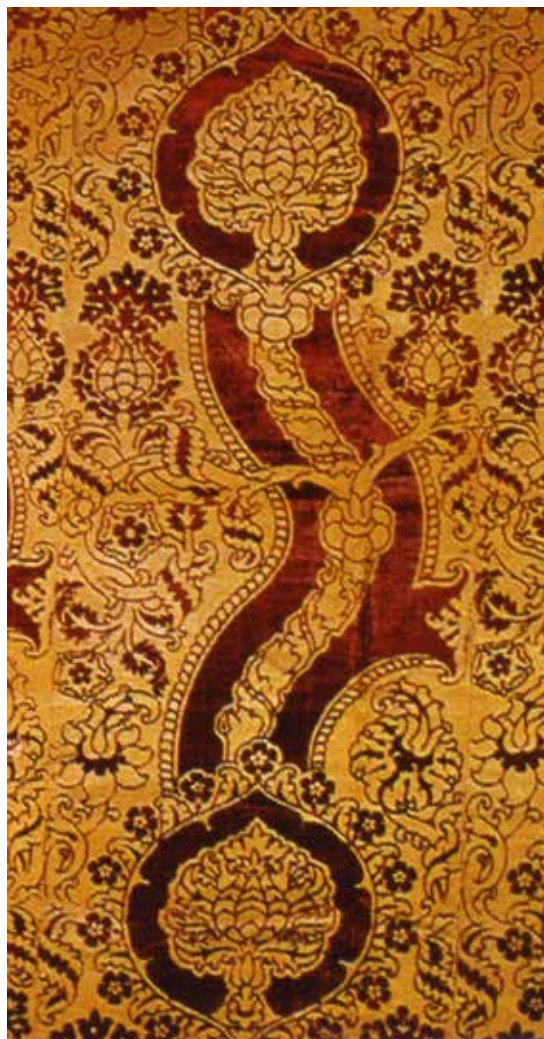
3. Venezia o Firenze, meta XV sec., velluto operato a 1 corpo, tagliato e riccio, lanciato e broccato bouclé con oro filato ( velluto a griccia ), Milano, collezione privata

colò III 18 . Questi testi erano ben noti e molto amati dalle sorelle di Leonello, Lucia e Ginevra, Beatrice e Bianca, come provano tutte le literae e motti ( brevij ) ricamati sulle loro vesti 19 e che Leonello stesso non doveva disdegnare se nel 1436 si fa ricamare dieci lettere d'oro su un vestido di panno turchino e verde 20 e se nel 1447 il famoso Frambaja gli ricama sulla spalla di un vestido un bersaglio trafitto da frecce, con numerose altre frecce intere e spezzate lungo l'intera manica, tutto in argento filato in un campo completamente coperto da tremolanti in argento dorato 21 . Sembrerebbe dunque il riferimento cromatico quasi dovuto alle mode culturali del tempo, anche se sappiamo da Angelo Decembrio che alla letteratura in lingua volgare Leonello preferiva di gran lunga quella latina, che aveva appreso con tale efficienza da permettergli di scrivere e presentare orazioni in quella lingua 22 .