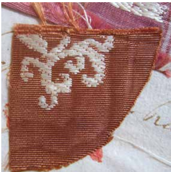
6. Campione di taffetas color lionato , in Mostre de Drappi Forastieri... , carta 5v, Milano, 1628